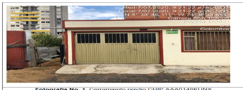
Fotografía No. 1. Cerramiento predio CHIP AAA0148KUNX.